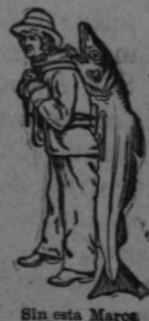
Sin esta Marca Ninguna es Legítima

NO CONTIENE ALCOHOL, GUAYACOL, CREOSOTA NI NINGUNA SUBSTANCIA NOCIVA O IRRITANTE.